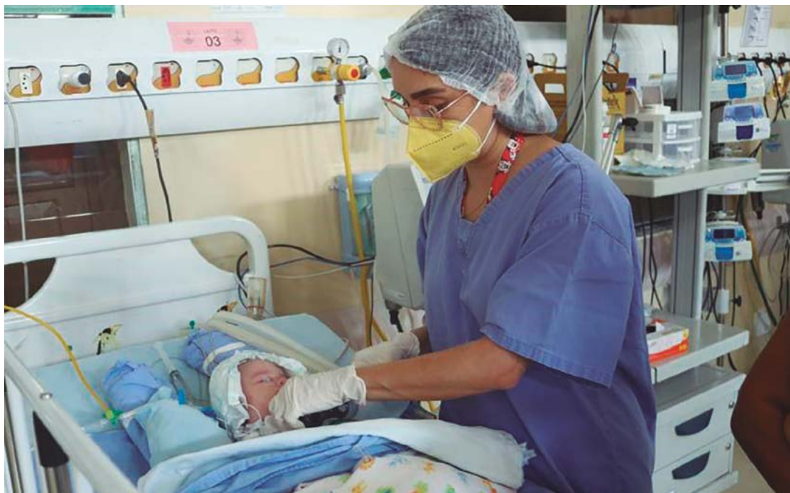
Centro, o 1º do tipo na região; é projetado para garantir ambiente acolhedor, seguro, humanizado e confortável

Em nota, a UEG informa alegou que "a proposta do novo plano de carreira para os docentes da UEG, que sanará também a questão das promoções dos professores que concluíram suas respectivas titulações, foi elaborada por comissão formada pelo Conselho Superior Universitário da UEG (CsU) e aprovada, posteriormente, pelos membros do Conselho". Segundo a instituição, a proposta está incluída na análise das carreiras que está sendo promovida pelo Governo de Goiás, por meio da Secretaria de Estado da Administração.