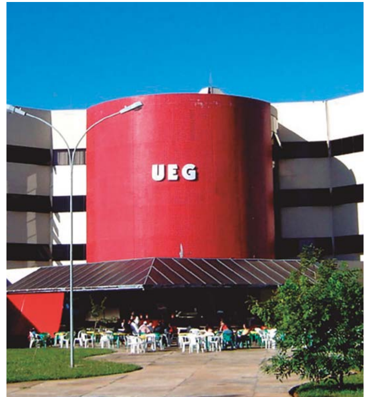
Segundo a Universidade Estadual de Goiás, a proposta está incluída na análise das carreiras que está sendo promovida pelo Governo de Goiás

A Santa Casa de Anápolis é conhecida como um dos centros hospitalares mais respeitados e indicados em Goiás. Prova disso é que, como Hospital Maternidade da Rede Cegonha e referência para gestação de alto risco, foi mais uma vez prestigiada com a certificação Hospital Amigo da Criança, Maternidade Segura e Parto Humanizado, emitida pelo Ministério da Saúde.