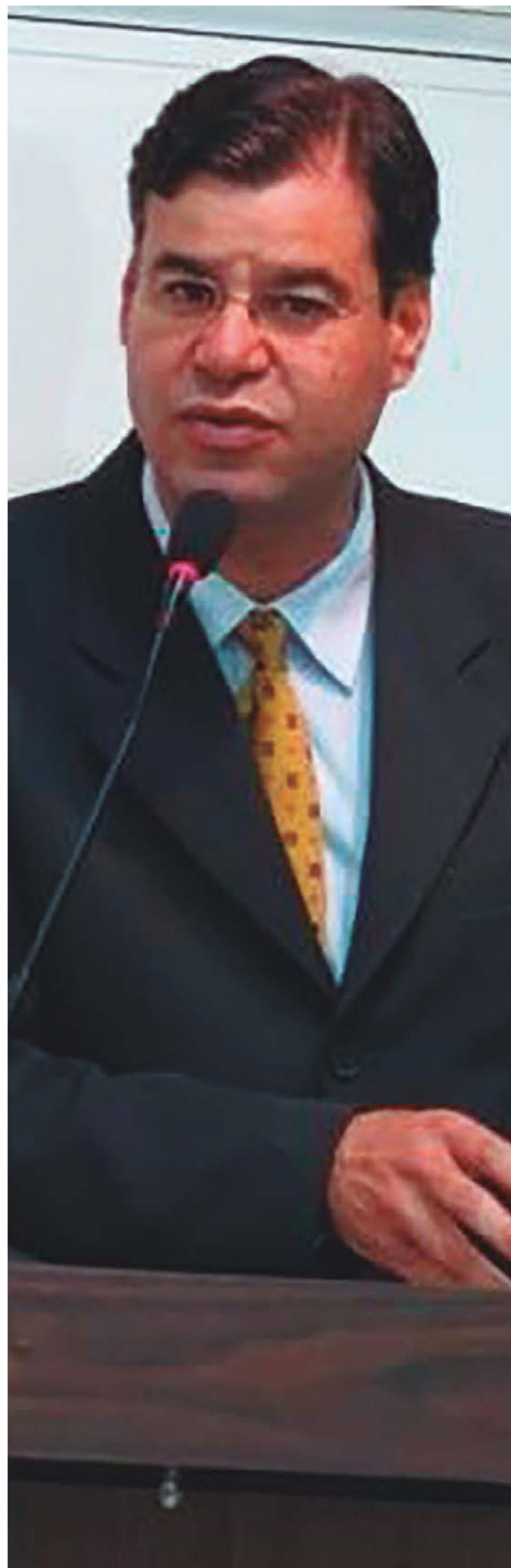
Gleuton Brito Freire é reconhecido por sua atuação conciliadora, mas o magistrado projeta ação enérgica contra propagação de mentiras

Eu acredito que ainda o eleitor brasileiro tem dúvidas sobre as urnas eletrônicas, embora eu particularmente não tenha, porque como já presido eleições desde 1998, e em 2000 foram implementadas as urnas eletrônicas na jurisdição eleitoral que eu exerci à época, eu fiz todos os testes com a urna eletrônica. Eu fiz em 2000, 2002, 2004, 2006 e 2008. Nesse período, eu me convenci que não tem como fraudar a urna eletrônica. Porque se houver um hacker que seja um gênio e consiga fazê-lo, ele já teria se apresentado. Se houvesse um único mecanismo real, verdadeiro, de que houve fraude em urna eletrônica, nós já teríamos conseguido saber. E eu jamais, como juiz, acreditando e vivendo pela verdade, ficaria calado diante da possibilidade de que houvesse fraude numa urna eletrônica.