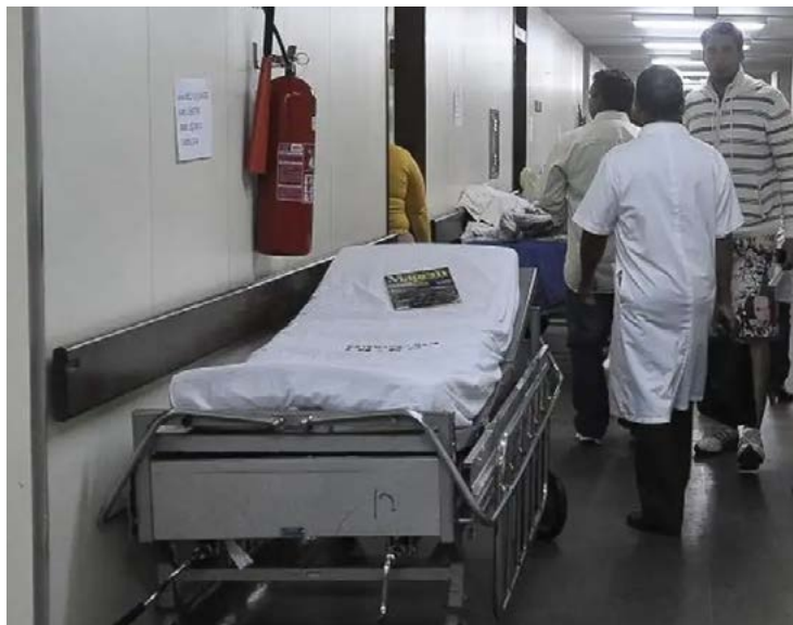
5,6 mil pessoas tiveram o órgão amputado por causa de complicações da doença

“Nós temos um medo muito grande de qualquer doença que impacta a sexualidade e, é claro, se eu tenho uma doença no pênis, e o tratamento muitas vezes é de extração parcial, às vezes, total do pênis, isso