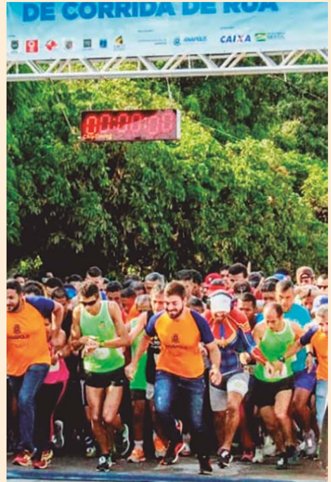
Tradicionalmente as provas em Anápolis reúnem cerca de cinco mil participantes da cidade e de várias outras regiões