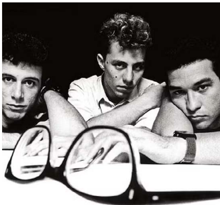
Anos 80: banda trouxe brasilidade à linguagem roqueira