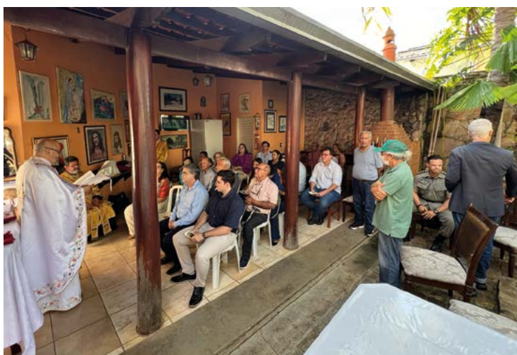
Espaço no quinta da casa de Batista vira temporariamente um templo de reflexão e fé. Amigos se aglomeram e depois partilham um lanche onde o diálogo e lembrança fraterna fazem o clima do ambiente